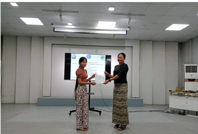
သင်တန်းဆင်းလက်မှတ်များပေးအပ်စဉ်