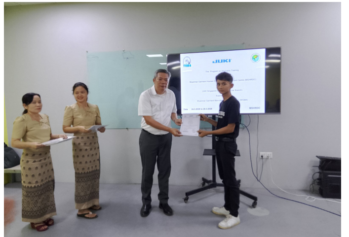
သင်တန်းဆင်းလက်မှတ်များ ပေးအပ်စဉ်