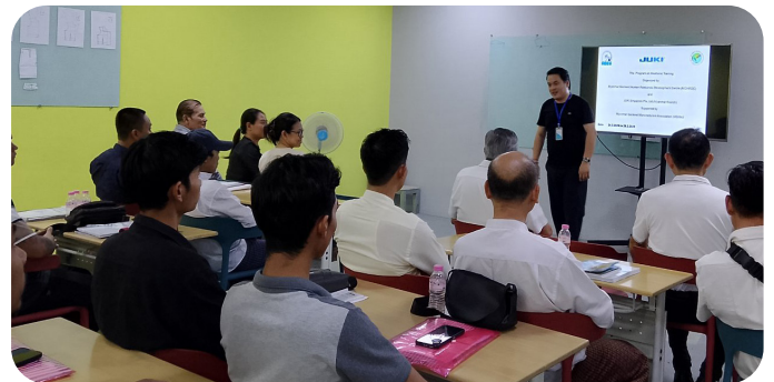
ဦးရဲခန့်မှ အပိတ်အမှာစကားပြောကြားစဉ်