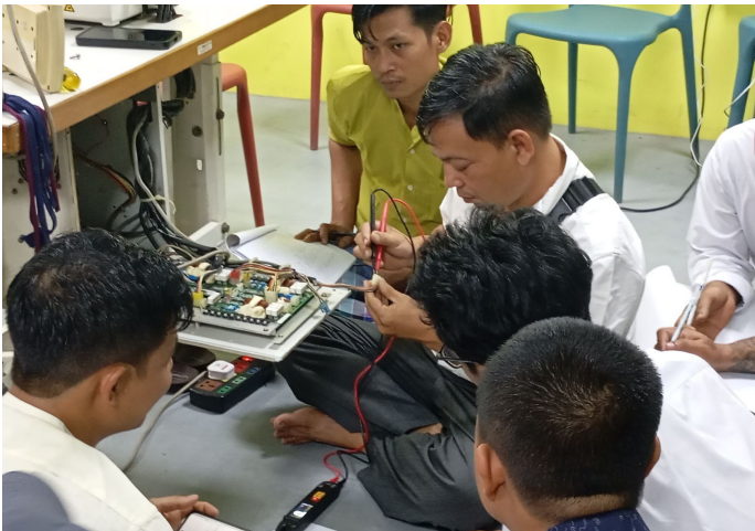
စက်ပြင်သင်တန်း သင်ကြားနေစဉ်