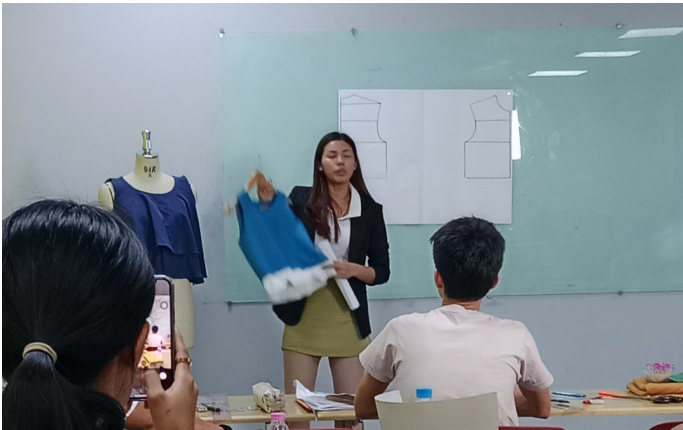
Pattern သင်တန်းသင်ကြားနေစဉ်