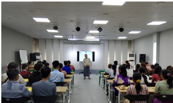
GTHS မှ ပါမောက္ခချုပ်မှ အဖွင့်အမှာစကားပြောကြားစဉ်