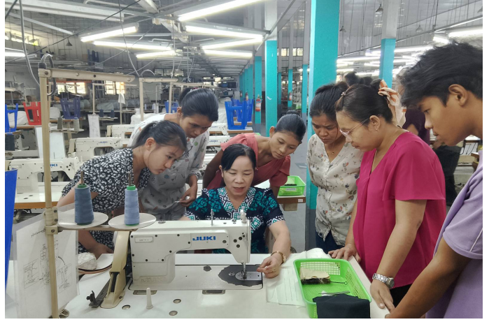
လက်တွေ့လေ့ကျင့်နေစဉ်