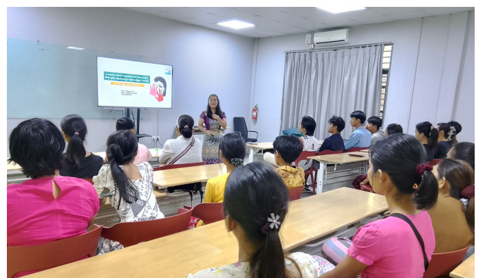
PSEA အကြောင်းဟောပြောစဉ်