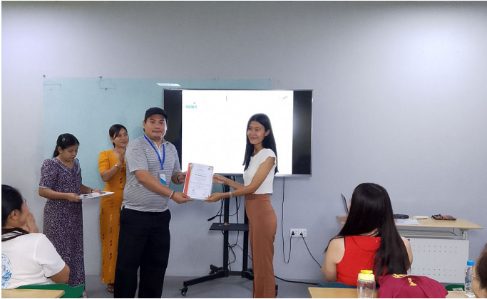
သင်တန်းဆင်းလက်မှတ်များ ပေးအပ်စဉ်