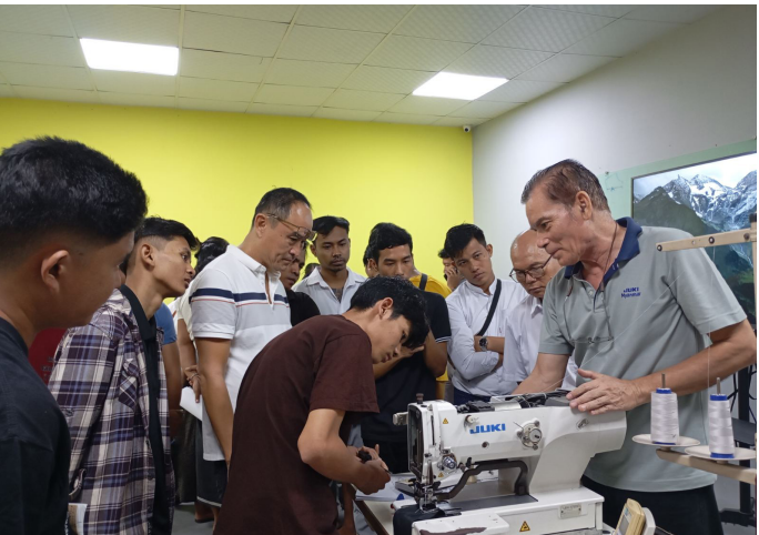
စက်ပြင်သင်တန်း သင်ကြားနေစဉ်