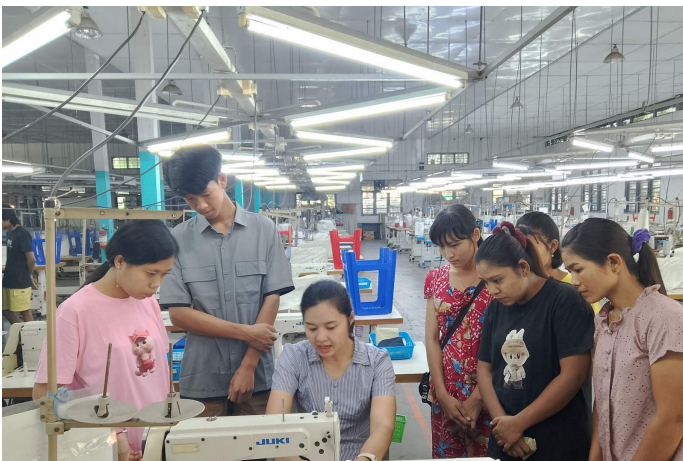
အဖွဲ့လိုက်လှုပ်ရှားမှုများ