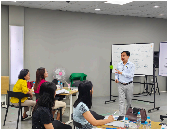
ဦးထွန်းထွန်းမှ WCC အကြောင်းရှင်းလင်းပြောကြားစဉ်