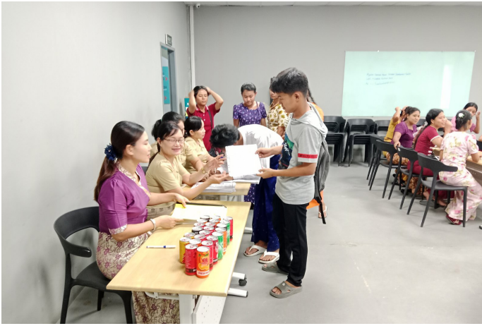
MGHRDC မှဆရာမများမှ Sewing Method များကိုသင်ကြားပေးနေစဉ်