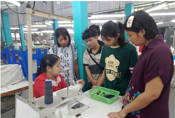
လက်တွေ့လေ့ကျင့်နေစဉ်