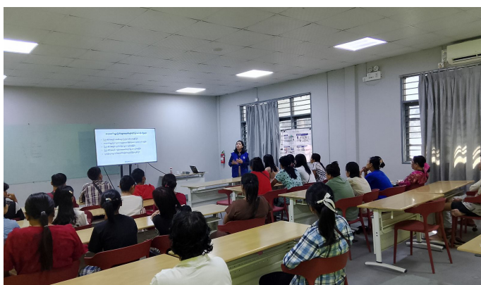
ရွှေ့ပြောင်းအလုပ်သမားများအကြောင်းဟောပြောစဉ်