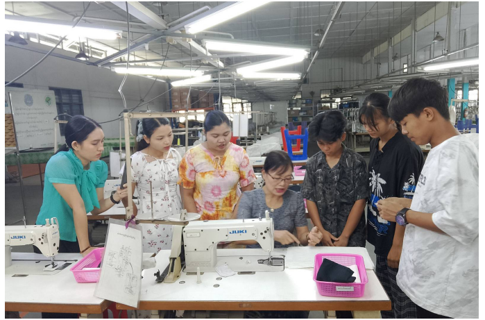
လက်တွေ့လေ့ကျင့်နေစဉ်