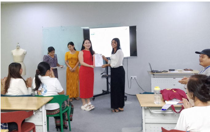
သင်တန်းဆင်းလက်မှတ်များ ပေးအပ်စဉ်