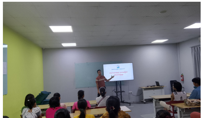
MGMA မှအလုပ်သမားဥပဒေအကြောင်းဟောပြောစဉ်