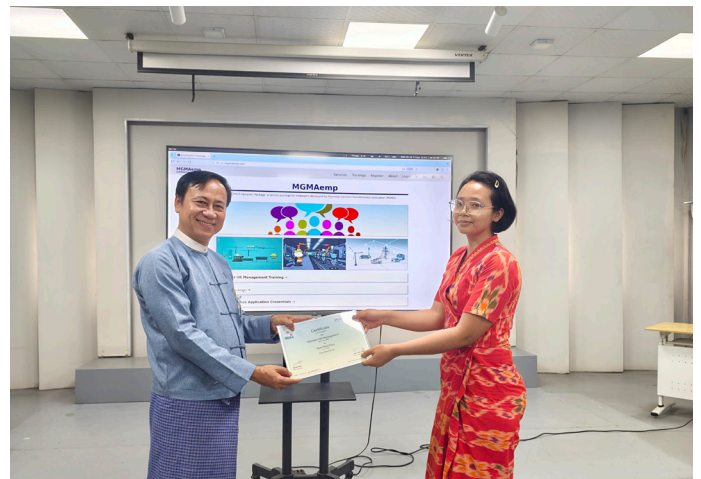
သင်တန်းဆင်း လက်မှတ်ပေးအပ်စဉ်