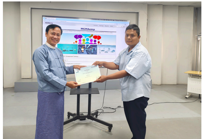
သင်တန်းဆင်း လက်မှတ်ပေးအပ်စဉ်