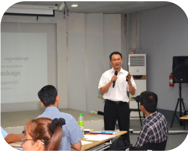
Senior Labour Officer of MGMA presenting Garment HR Management