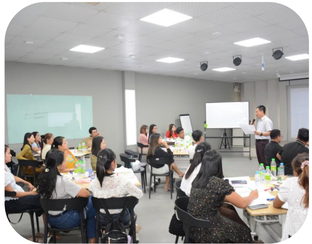
Senior Labour Officer of MGMA presenting Garment HR Management