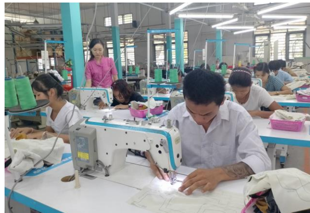
Trainer of MGHRDC presenting sewing method