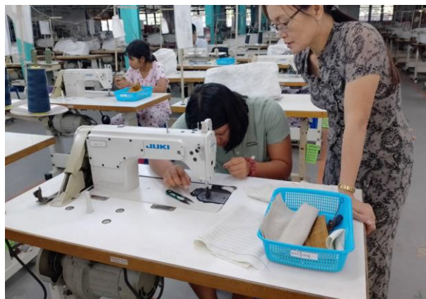
Trainer of MGHRDC presenting sewing method