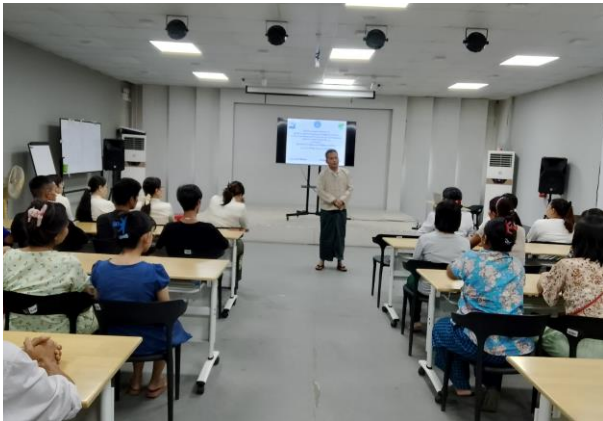
Principle of GTHS (Ywarma) giving opening remarks