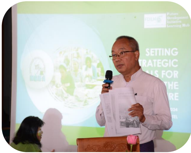
Chairman of MGMA U Myint Soe giving opening remarks