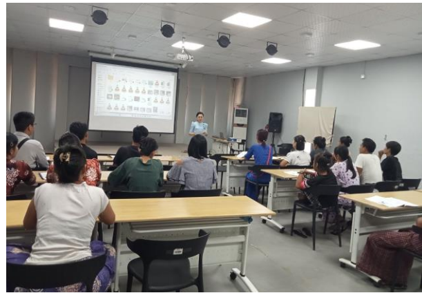
Trainer of MGHRDC presenting sewing method