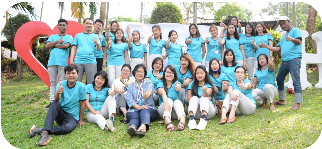
MGMA Staff Group Photo

explained the organization strategies. The workshop was attended by (21) MGMA staff and included Q&A sessions and group activities.