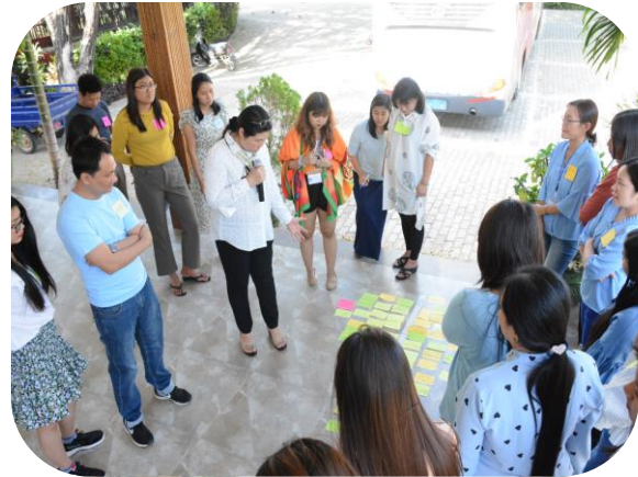
Discussing about organization achievement