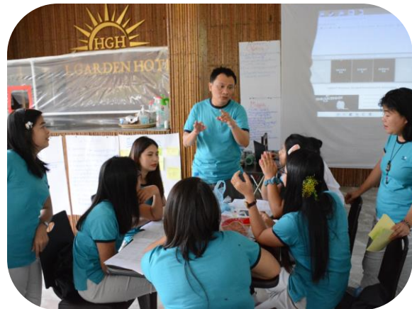
Discussing about organizational strategy