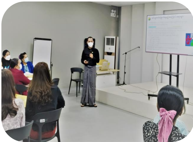
Trainer from WSH Myanmar Presenting OSH

hazards, determining appropriate control measures, and developing and implementing OSH policies and programs. Total (34) participants from MGMA member factories attended the training, which included Q&A sessions with group discussions. Voluntray Audit of MGMA U Thein Pe Win gave closing remarks and training was successfully concluded.